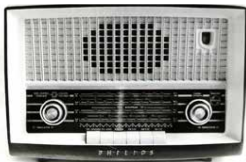
Fig. 42 - receptor modelo consolete fabricado pela Philips, Holanda no início dos anos 50.