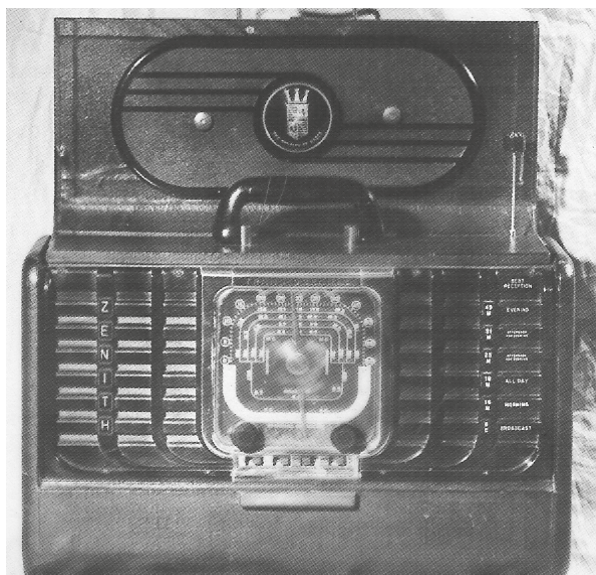
Fig. 40 - um dos primeiros rádios portáteis feitos pela Zenith nos EUA em 1948, modelo 5G40 operando com 5 válvulas com 6 faixas de frequência para operação tanto a rede como bateria. (Coleção Maria de Oliveira)